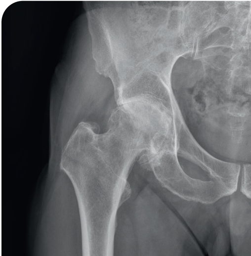
Hüftgelenksröntgen mit deutlichen Arthrosezeichen

Wenn sämtliche konservative Behandlungsmethoden, wie Infiltrationen, Physiotherapie, physikalische Therapie, nicht mehr den gewünschten Erfolg bringen, dann ist der Austausch des Gelenks mit einem künstlichen Gelenk der nächste Behandlungsschritt.