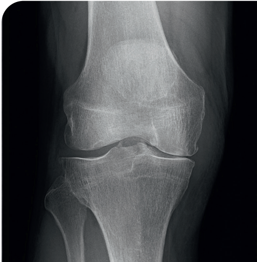
Hüftgelenksröntgen mit deutlichen Arthrosezeichen

Standardisierte Behandlungsabläufe - von der Diagnosestellung über die Vorbereitung auf die Operation, die Operation selbst bis hin zur Entlassung - ermöglichen einen möglichst kurz gehaltenen Krankenhausaufenthalt. Auf diese Weise können viele Risiken (wie z.B. Erkrankungen am Herz-Kreislaufsystem) minimiert werden und Sie finden schnellstmöglich zu ihrer ursprünglichen Aktivität zurück.