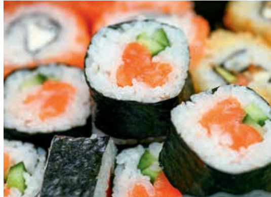
Für die Ummantelung von Maki-Röllchen werden Algen verwendet.

Die Inhaltsstoffe der Algen wirken nachweislich auf unser Immunsystem und haben antivirale, antibiotische und krebsvorbeugende Effekte. Die geringe Brustkrebsrate der Japanerinnen führen manche Wissenschaftler auf deren hohen Algenverzehr zurück.