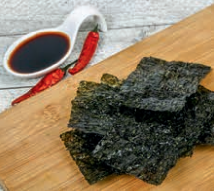
Getrocknete Nori-Algen sind ein beliebter Snack.